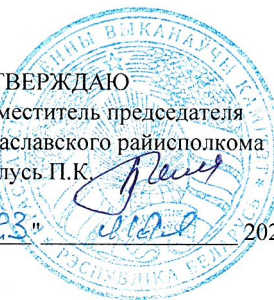
ГРАФИК оформления и регистрации паспортов готовности потребителей тепловой энергии и теплоисточников к работе в осенне-зимний период 2024/2025 года организациями Браславского района